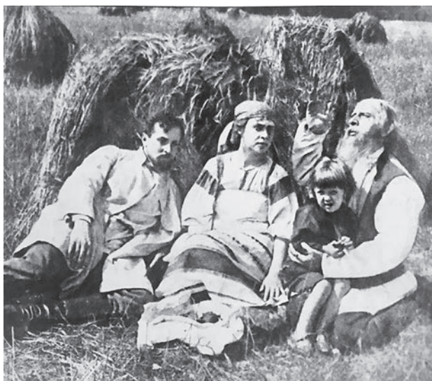
Рис. 4. Из буклета с либретто «Темной веры» (М.: Издание Кинематографического отдела Скобелевского комитета, 1918). РГАЛИ. Ф. 2057. Оп. 1. Ед. хр. 5. Л. 24

И мужики, стоя в сторонке, умилились: что-то шепчут один другому, и просветлели угрюмые деревенские лица, глядя на деда и внука.