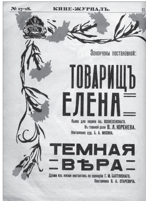
Рис. 1. Реклама фильма «Темная вера». «Кинезурналь». 1917. № 17. 24–30 декабря. Б. п.