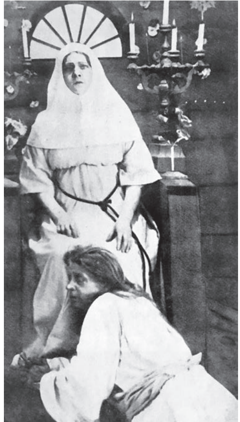
Рис. 3. Из буклета с либретто «Темной веры» (М.: Издание Кинематографического отдела Скобелевского комитета, 1918). РГАЛИ. Ф. 2057. Оп. 1. Ед. хр. 5. Л. 23

Богородица велит допустить в ее комнату, имеющую вид большой кельи, богато уставленной иконами, Ивана Егоровича. Старший братец, тот самый, что «посвящал» Ивана Егоровича, быстро подходит и шепчет что-то на ухо богородице. Та кивает понятиливо головой. Принимает торжественный вид. Вводят Ивана Егоровича. Он трижды кланяется богородице коленопреклоненно, потом подходит и набожно целует ее руку, которою она благословляет его. Затем задает ему вопрос. Он смиренно отвечает. Наконец, богородица сурово наставляет его: