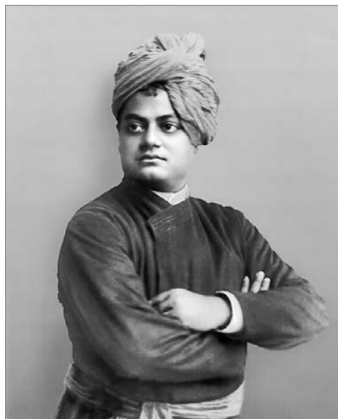
Фото 1. Вивекананда

европейское образование ученых-индусов, учеников реформатора индуизма Рамакришны (1836–1886): Свами 2 Абхедананды (1866–1939) и Свами Вивекананды (1863–1902). Выступление Вивекананды (фото 1) в Чикаго в 1893 г. на Всемирном парламенте религий способствовало бурному интересу к индуизму в странах Запада. Князь С. Г. Волконский, присутствовавший на конгрессе в качестве представителя министерства народного просвещения России, писал о своем впечатлении от его доклада: «В оранжевом кафтане с желтой чалмой, великолепная фигура бронзового индуса с гордой осанкой индийского магараджи: это нищенствующий монах одной из многочисленных индусских сект, рослый, плечистый, с детской наивностью в глазах. Ходит и осматривается, как большой ребенок, всему радуется, ничему не удивляется, красноречивый неиссякаемо, как горный поток, с восточной яркостью в примерах и каким-то былинным причитанием в незатейливых речах. Суоми 3 Вивекананда – это его имя – сделался одним из любимцев толпы» [11, с. 77]. Работы Вивекананды сразу же привлекли внимание русского общества. Л. Н. Толстой получил в подарок «Раджа-йогу» в сентябре 1896 г. от индийского ученого Анендра Кришна. В трудах Вивекананды Толстой нашел много мудрых мыслей для своей книги афоризмов «Круг чтения».