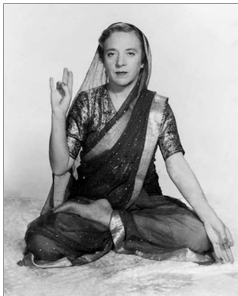
Фото 6. Индра Деви

нера своего сына, то от кого угодно другого. Интерес к древнеиндийской философии и культуре был важной составляющей эпохи Серебряного века. «Исторически последнее Возрождение» [30], следуя алгоритму Ренессанса, обрело свою прародину в «Индии Духа» (Гумилёв) 10 .