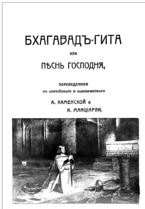
Фото 3. «Бхагавад-гита», издание 1914 г.