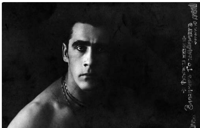
Фото 4. Владимир Гольцшмидт

написал на основе индусских мотивов музыку для премьеры А. Я. Таирова «Сакунтала», в молодом возрасте вынужден был поселиться в Ялте по причине тяжелой формы туберкулеза. Желая избавиться от недуга, В. И. Польш усиленно лечился всеми возможными способами, в том числе стал последователем йоги и осознанным вегетарианцем, не употреблял алкоголь и табак. По воспоминаниям С. К. Маковского, он был костист, подтянут, дышал фактически одним легким, но при этом придерживался предписаний индусской йоги: выполнял упражнения, растирался щеткой, часто бывал на свежем воздухе, совершал длительные прогулки в любую погоду, стремился подчинить тело духу и нередко повторял: «Человек должен добиться власти над всем обменом веществ, над каждым дыханием живой клетки» [27, с. 560–577]. Вокруг него даже возникла легенда «многоопытного мудреца», побывавшего в Индии, хотя он там никогда не был. В. И. Полю удалось справиться с тяжелой болезнью. В московский период жизни в его доме на Садово-Кудринской, где он поселился со второй женой, камерной певицей А. М. Петрункевич (псевдоним Ян-Рубан), всегда было многолюдно. Он дружил с Сергеем