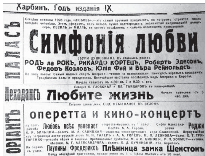
Рис. 7. Газета «Заря». 1928. № 84 (28 марта). С. 1