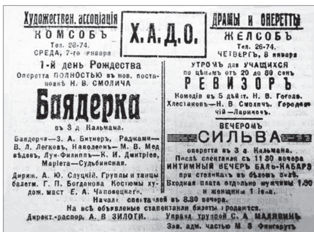
Рис. 6. Анонс спектаклей Художественной ассоциации драмы и оперетты (ХАДО). Газета «Заря». 1925. № 6 (10 января). С. 1

В 1926 году еще предпринимаются попытки обмена театральными коллективами с советским ДВК. После окончания сезона в театре «Мозаика» труппа оперетты поехала на гастроли в Приморье, однако возникли проблемы с таможней, паспортами. Добавились организационные сложности: в ДВК работала своя труппа оперетты созданного там театрального объединения, и приезд харбинцев нарушал планы ее перемещений. В результате расстроившихся гастролей часть артистов вернулась в Харбин, а некоторые приняли предложения из других городов 19 .