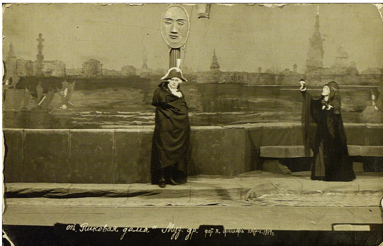
Сцена из спектакля «Пиковая дама», Театр музыкальной драмы, 1914 (РГБИ, отдел иконографии, инв № ф 6133)