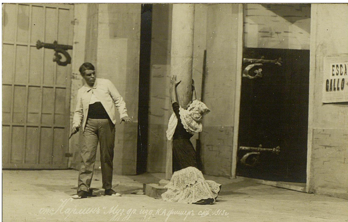
Сцена из постановки «Кармен» Ж. Бизе, Театр музыкальной драмы, 1913, Санкт-Петербург (РГБИ, отдел иконографии, инв. № ф 6124)