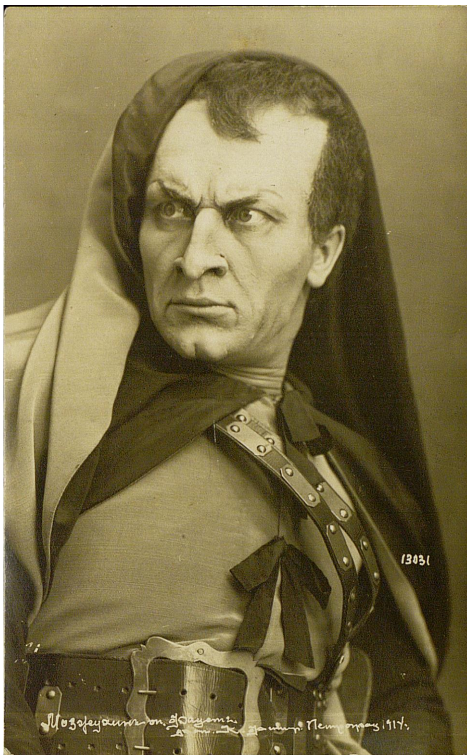
А.И. Мозжухин в роли Мефистофеля, «Фауст» Ш. Гуно, Театр музыкальной драмы, 1914 (РГБИ, отдел иконографии, инв. № ф 6137)