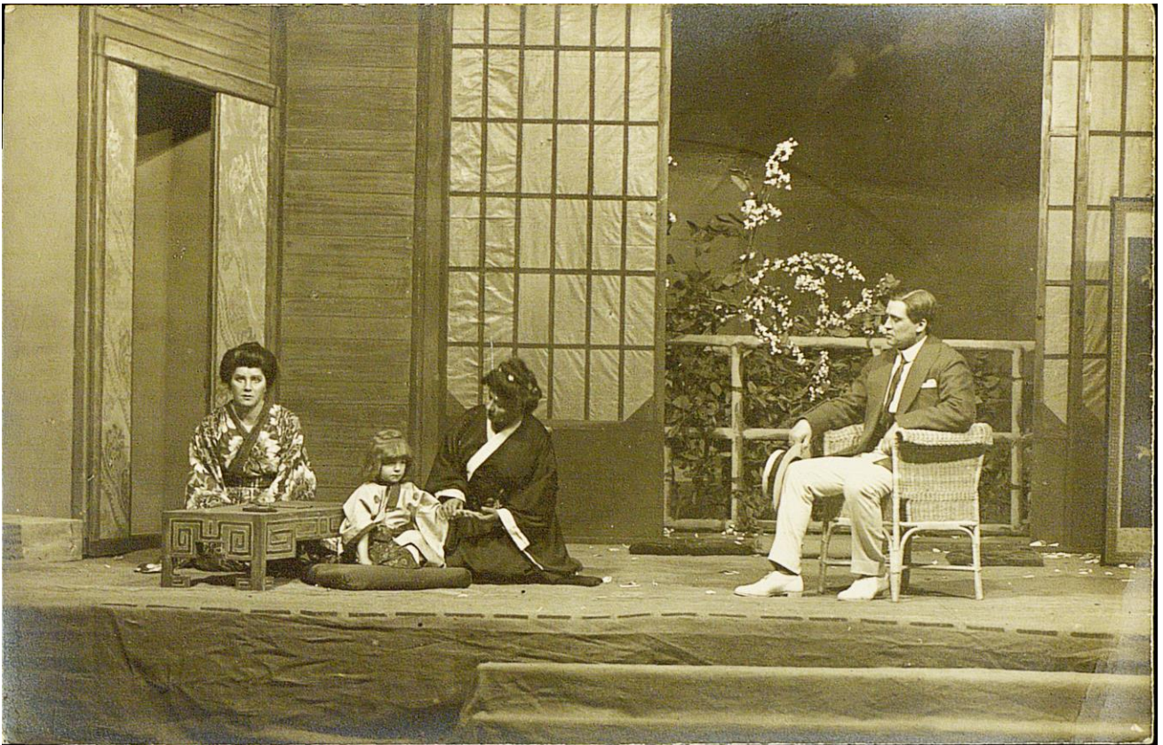
Сцена из спектакля «Мадам Баттерфляй», Театр музыкальной драмы, 1915