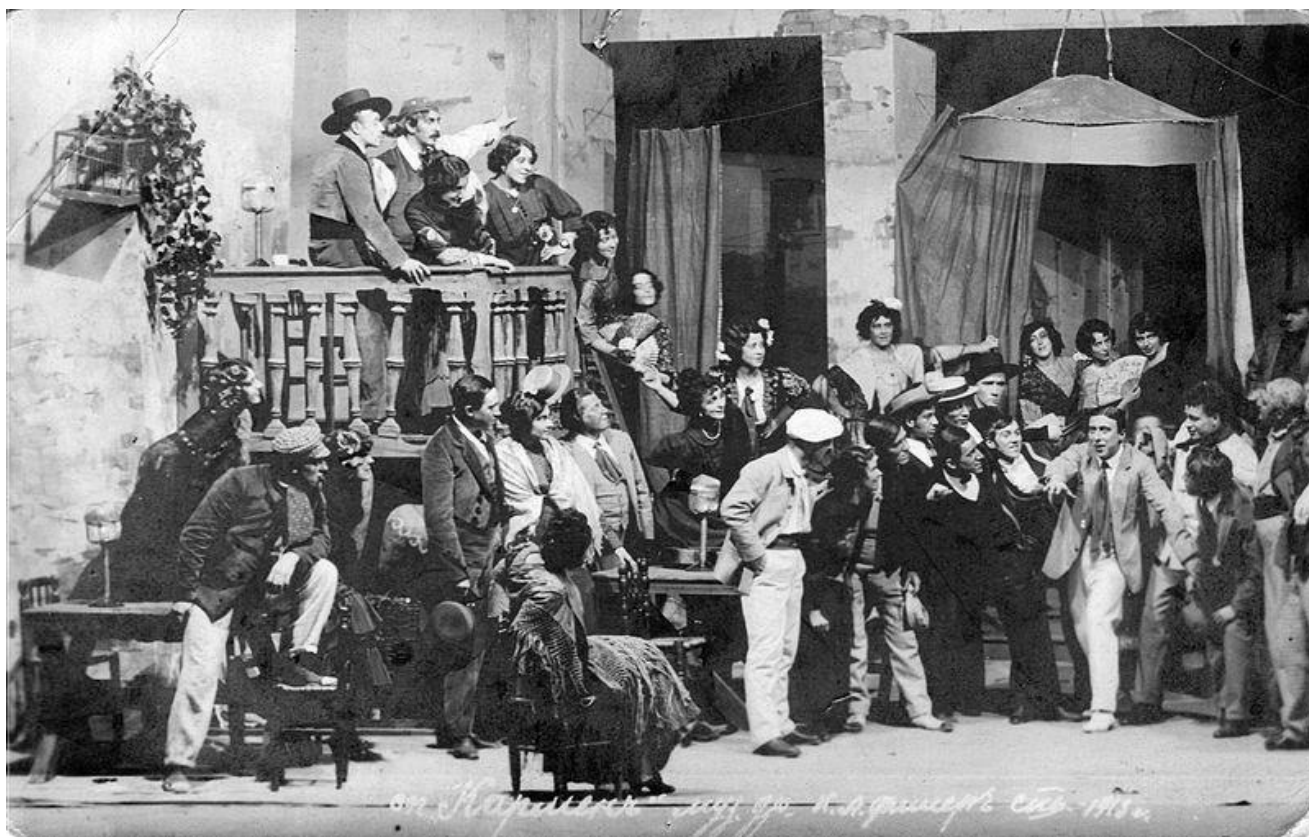
Сцена из постановки «Кармен» Ж. Бизе, Театр музыкальной драмы, 1913, Санкт-Петербург (РГБИ, отдел иконографии, инв. № ф 6124/2 )